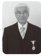
受章御礼並びに退任の御挨拶

氏は、昭和45年から父が経営する現(有)今野商店に勤務され、平成10年には経営を引継ぎ代表取締役に就任し現在まで事業を盛り立ててきました。商工会では、昭和53年から米山町商工会の理事を務め、平成12年には同副会長、米山、豊里、南方三町商工会が合併した平成17年から理事、副会長を務め、平成24年からは会長を務められました。本年5月に会長を退任されましたが、この間商工関係団体の役員、行政機関の委員などを数多く歴任し、功績を残されました。その他にも宮城県小売酒販組合連合会(現副会長)・宮城県酒販協同組合連合会(現副会長)での功績もあり旭日双光章の受賞となりました。